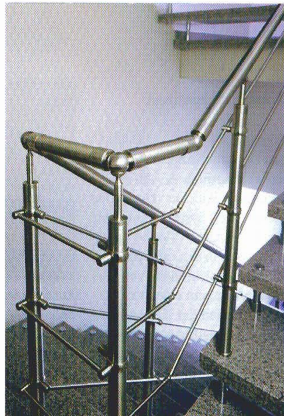
Das Geländer wird ohne Schweißen, Schleifen und Bohren montiert.

Mit den Lochrastern, die im Pfosten verschwinden, ist bei der Montage eine einfache Höhenverstellung des Handlaufs möglich.